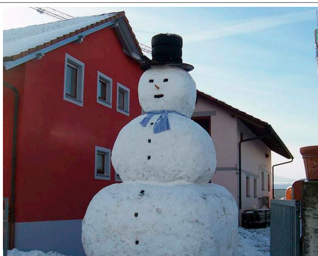
„Mann, oh (Schnee-)Mann!“

Bahlingen. Letzte Woche, in der Nacht von Donnerstag auf Freitag, versuchten bislang unbekannte Täter in die Silberberg-Apotheke an der Hauptstraße einzubrechen. Trotz massiver Hebelversuche hielt die Eingangstüre stand, sodass es beim Versuch blieb.