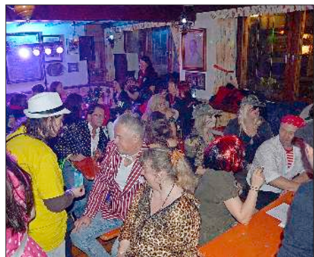
Am Faschnachtsfreitag war der „Hecht“ eine erstklassige Adresse für alle feierfreudigen Narren.