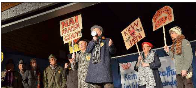
Der Widerstand gegen das geplante AKW formierte sich lautstark.