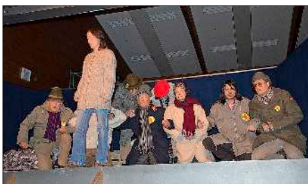
Angstvolle Blicke auf dem Bauplatz vor der Räumung.