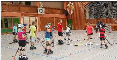
Mit viel Elan und Spaß am Sport geht es in der Laufschiule zur Sache.