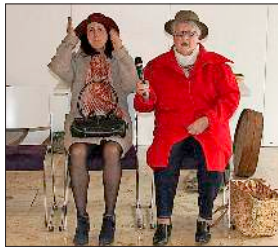
„Z'Licht goh“ beim Seniorennachmittag.

Bötzingen (dht). Einen unterhaltsamen Seniorennachmittag gab es bei der evangelischen Kirchengemeinde mit dem „Z'Licht goh“, bei dem sich die Besucher an alte Zeiten erinnern.