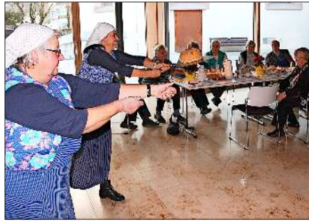
Bewegungsgeschichte zum Mitmachen: „Vom Korn säen bis zum Brot backen“.