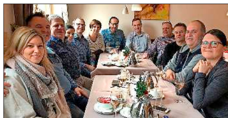
In entspannter Atmosphäre besprachen die Gewerbetreibenden die Pläne fürs kommende Jahr.

Lemke unter dem Motto „Schön war die Zeit“. Ein Mix aus symphonischen Werken, Pop und Marschmusik wartet auf das Publikum. Nach dem Konzert ist für Unterhaltung mit den DJs Bärenbrüder gesorgt.