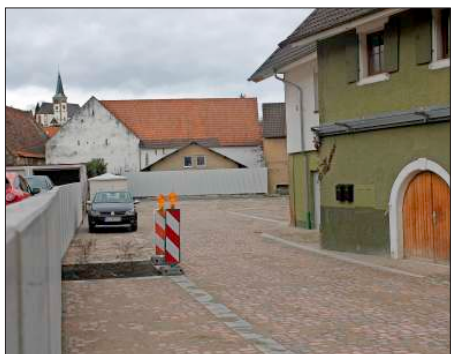
Der neue Parkplatz beim Rössle ist fertiggestellt und kann ab sofort benutzt werden.

Fragen der Bürger Ein Bürger möchte wissen, ob Notartermine nach Wegfall des Grundbuchamtes nicht mehr in Bahlingen stattfinden werden. Bgm. Lotis bestätigt, dass Kaufverträge usw. ab November nur noch in Emmendingen oder bei freien Notaren beurkundet werden können.