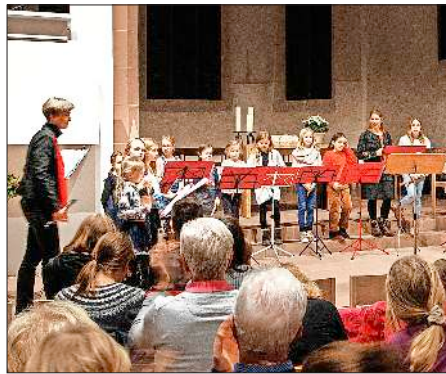
Viel Applaus gab es für den Flöten-Nachwuchs.

■ Mittwoch, 29. Januar Neubürgerempfang, Gemeinde Bahlingen, 18-21 Uhr, Pausenhalle.