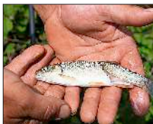
Ein von einem Fischreier am Schwanz verletzter Döbel.

Dementsprechend waren die Eichstetter Fließgewässer Mühlbach, Nägelegraben, Herrenmühlbach, Mühlkanal, alte Dreismal und Dreismal aufgewühlt und sehr trübe sowie voller angeschwemmter, herabgefallener Baumäste. Nur sechs Mitglieder und Vereinsfischer hatten sich frühmorgens am Angelweiher eingefunden. Nach kurzer Überlegung, ob das Hegefischen nicht verschoben werden solle, entschied man sich jedoch nach einem traditionellen Schnäpschen und gegenseitigem „Petri Heil“ und „Petri Dank“ doch dafür, die Gewässer zum Fischen aufzusuchen. Jeder Fischer bezog Position an einem Gewässer seiner Wahl. Die Fische und vor allem die Döbel bissen wegen des sehr trüben und braunen Wassers nur sehr zögerlich.