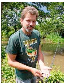
Fischer am Mühlbach mit einem gefangenen Döbel.

Eichstetten (dht). Vergangenen Sonntagvormittag fand das letzte jährliche Hegefischen auf Döbel der Kaiserstühler Sportangler Eichstetten in sämtlichen Fließgewässern – außer dem Angelweiher – statt. Das Hegefischen fiel jedoch fast ganz ins Wasser, da es am Abend des Vortages heftig gewittert und geregnet hatte.