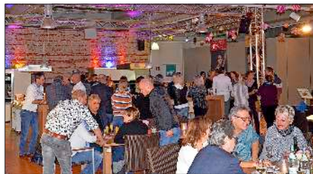
Die Gäste genossen die besondere Atmosphäre im Maier Küchen-Showroom.

Bahlingen (bos). Küchenfeeling bei Nacht gab es vergangenen Freitag zum zweiten Mal bei Maier Küchen. Ebenso wie bei der Premiere im Vorjahr nutzten einige hundert Besucher die Gelegenheit, den bereits weihnachtlich dekorierten und stimmungsvoll beleuchteten Showroom zu erkunden. Dazu gab es einige kleine kulinarische Köstlichkeiten, Sekt und Glühwein.